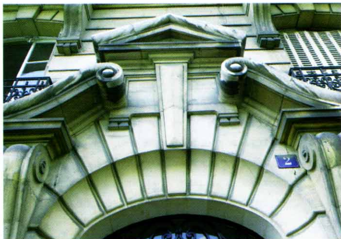
DÉTAIL DE L'ENTRÉE - RUE DE LA LIBERTÉ.