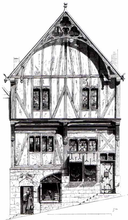
CHARPENTE DE PIGNON EN AUVENT, ILL. 21, IN EUGÈNE-EMMANUEL VIOLLET-LE-DUC : ENCYCLOPÉDIE MÉDIÉVALE , FAC-SIMILÉ. COLL. PART.